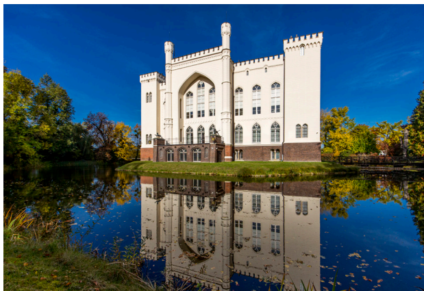
1 Zamek w Kórniku

Jest to bodajże najlepiej znany zamek na terenie Wielkopolski, co nie powinno dziwić, biorąc pod uwagę wyjątkową architekturę, zachowane bogate wyposażenie oraz związane z nim legendy. Najstarsza budowla obronna powstała już w połowie XIV w. z inicjatywy biskupa poznańskiego Mikołaja z Kórnika. W następnych stuleciach warownia stała się elegancką rezydencją należącą kolejno do możnych rodów Górków i Działyńskich. Obecnie jest siedzibą Biblioteki Kórnickiej PAN .