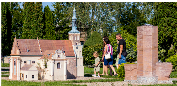
1 Skansen Miniatur w Pobiedziskach

Nazwa miasta ma według legendy pochodzić od faktu, że tutaj mieli „poobiadać”, czyli zasiąść do posiłku legendarni bracia Lech, Czech i Rus; inna wersja wskazuje na słowo „pobieda”, oznaczające zwycięstwo. Tak czy inaczej, Pobiedziska to miejscowość o starym rodowodzie, o czym najlepiej świadczy gotycki kościół św. Michała Archanioła , stojący przy rynku. W ceglach tworzących elewację znajdują się zagadkowe zagłębienia, najprawdopodobniej związane z zapomnianym już obrzędem krzesania ognia na Wielkanoc.