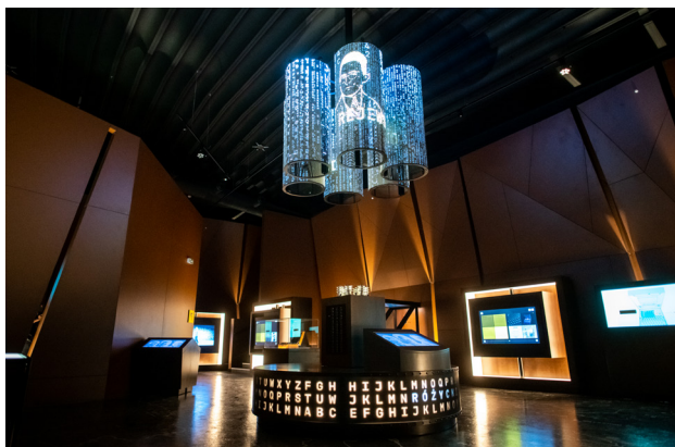
1 Centrum Szyfrów Enigma

jej neoklasycystyczny Teatr Wielki , a także zabytkowe gmachy uniwersytetu, dykcja kolei i poczta główna. Tuż obok zamku znajduje się Centrum Szyfrów Enigma , prezentujące w interaktywny sposób historię kryptologii od antyku do współczesności. Kluczowe są jednak postaci trzech genialnych poznańskich kryptologów: Mariana Rejewskiego, Jerzego Różyckiego i Henryka Zygalskiego, którzy złamali szyfr niemieckiej maszyny szyfrującej Enigma, czym wydatnie przyczynili się do zwycięstwa aliantów.