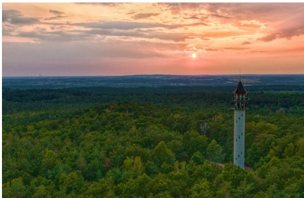
1 Dziewicza Góra

Park Krajobrazowy Puszcza Zielonka to drugie po WPN, z zielonych płuc Poznania – ogromny las, który rozpoczyna się niemal tuż za granicami miasta. Rzeźba terenu została ukształtowana przez łądolód skandynawski podczas ostatniego zlodowacenia. Jego dziełem są liczne wzgórza morenowe, w tym najwyższy szczyt – Dziewicza Góra (143 m n.p.m.) i głęboko wyrzeźbione rynnowe jeziora o wydłużonych kształtach. W granicach parku wyznaczono pięć rezerwatów, dla jeszcze lepszej ochrony najcenniejszych przedstawicieli fauny i flory.