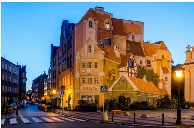
1 Mural na Śródce

również kaplica królewska, z potężnych rozmiarów epitafium króla Przemysła II, jego żony Rychey i ojca – księcia Przemysła I. W poznańskiej katedrze pochowano także króla Mieszka II, są tam również groby książąt: Kazimierza Odnowiciela, Odoną Mieszko-wica, Władysława Odonica oraz Bolesława Pobożnego. Z gotycką architekturą doskonale współgrają ołtarz pochodzący z 1512 r. oraz gotyckie stalle. Z tej epoki pochodzi też pięć spizowych płyt nagrobnych, wykonanych w słynnym norymberskim zakładzie Vischerów. W północnej wieży katedry znajduje się punkt widokowy z piękną panoramą miasta.