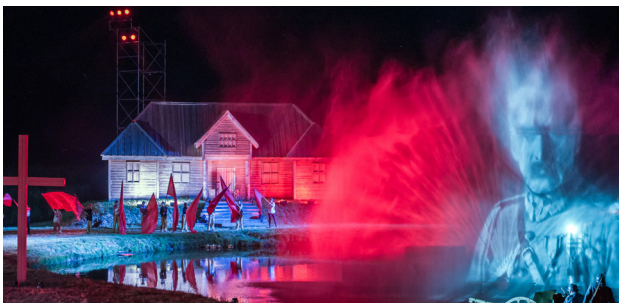
1 Widowisko Orzeł i Krzyż w Murowanej Goślinie

W okolicach Poznania koniecznie trzeba odwiedzić Deli Park – rodzinny park rozrywki i edukacji z dmuchaną strefą wodną, papugarnią i podniebną wioską. Najwięcej gości do Deli Parku przyciągają jesienny Festiwal Dyni oraz zimowe iluminacje świąteczne. Warto też wybrać się na rodzinny wypad do Borówca, aby obejrzeć kolejową Makiętę Borówiec . Zbudowana na powierzchni ponad 450 m 2 w skali 1:87 makieta wciąż się rozwija. Obejmuje 12 pociągów w ciągłym ruchu, lotnisko oraz całe miasta i wsie. Żywej historii dotkniecie z kolei w Parku Dzieje w Murowanej Goślinie. Na gości czekają tu animatorzy prowadzący liczne zabawy i warsztaty o tematyce historycznej. W niektóre dni odbywają się fabularne widowiska z konnymi grupami rekonstrukcyjnymi. Co roku na przełomie czerwca i lipca organizowane jest największe w Polsce plenerowe widowisko Orzeł i Krzyż , podczas którego ponad 300 aktorów wciela się w 1500 historycznych postaci. A to wszystko w otoczeniu pirotechniki, mappingu i efektów specjalnych.