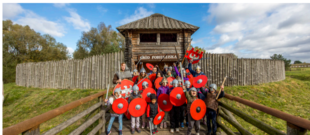
1 Gród Pobiedziska

Zaledwie kilka kroków dalej ulokował się Gród Pobiedziska . Jest to współczesna rekonstrukcja wczesnośredniowiecznego grodu, która świetnie obrazuje, jak wznoszono budowle obronne w epoce pierwszych Piastów. Gród posiada fosę, nad którą przerzucono most, solidną palisadę oraz umocnioną bramę z wieżą obserwacyjną. Wewnątrz znajduje się wystawa średniowiecznych machin oblężniczych. Wiele z nich można własnoręcznie wypróbować. Organizowane są także turnieje tucznicze, a odwiedzający mogą przymierzyć kolczugę i chwycić za prawdziwy miecz.