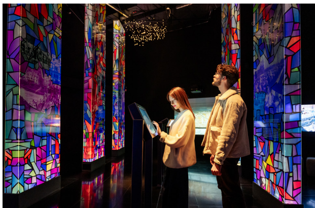
1 Brama Poznania ICHOT

historii Wyspy Katedralnej i całego Poznania. Obowiązkowy punkt każdego pobytu w mieście.