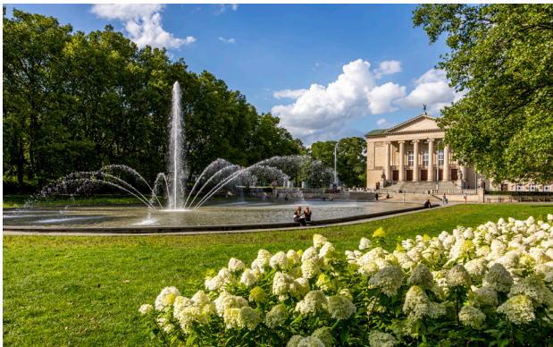
1 Widok na Teatr Wielki z Parku Adma Mickiewicza

W okolicy alei Niepodległości jeszcze na przelocie XIX i XX w. były potężne umocnienia Twierdzy Poznań. Po ich zniwelowaniu rozplanowano całkiem nową, reprezentacyjną dzielnicę. Jej sercem stał się Zamek Cesarski , zbudowany dla cesarza Wilhelma II – najmłodsza w Europie rezydencja monarcha. Towarzyszą