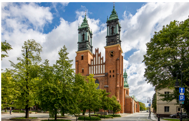
1 Katedra na Ostrowie Tumskim

syn, książę Przemysław II, zapoczątkował rozbudowę rezydencji, która – w zamyśle twórcy – miała w niedalekiej przyszłości stać się zamkiem królewskim. Odwiedzali go często również późniejsi monarchowie, jak Kazimierz Wielki czy Władysław Jagiełło. Zamek mieści w swoich murach Muzeum Sztuk Użytkowych, natomiast wieża jest doskonałym punktem widokowym na centrum Poznania.