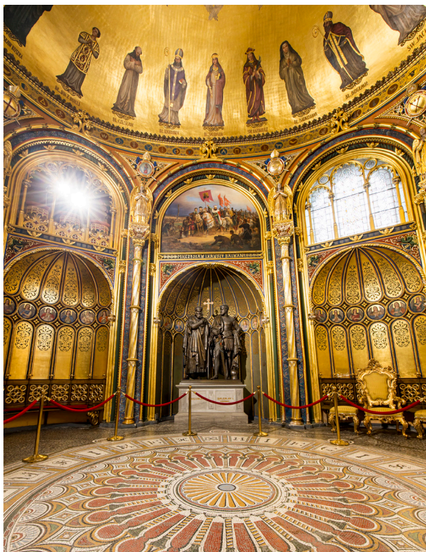
1 Złota Kaplica, fot. A. Ciereszko, visitpoznan.pl

wykonaną ze szkła hartowanego instalację artystyczną. Również i sam kościół jest bardzo ciekawy, a multimedialna ekspozycja wewnątrz przybliży dawne dzieje tego miejsca. W północną ścianę świątyni wmurowano potężny kamień. Podanie głosi, że jest to tron książęcy z czasów twórców państwa polskiego. Dzisiaj każdy może spróbować na nim zasiąść.