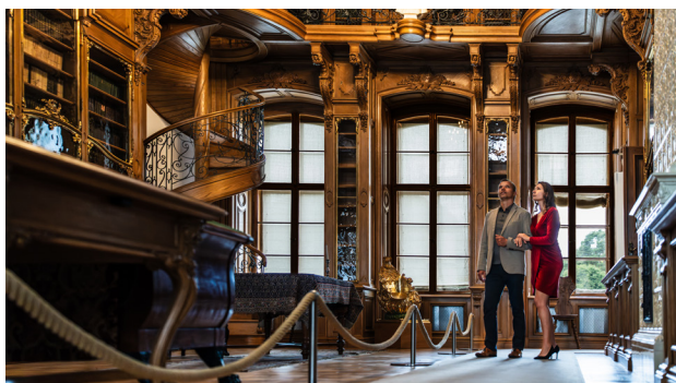
1 Biblioteka w Rogalinie

Tuż obok pałacu znajduje się galeria obrazów stworzona przez Edwarda Aleksandra Raczyńskiego, wybitnego znawcę sztuki. Spośród 305 obiektów zachowanych z przedwojennej kolekcji w chwili obecnej galeria zawiera 297 prac, w tym takich artystów jak Jacek Malczewski, Olga Boznańska, Aleksander Gierzyński, Leon Wyczółkowski czy Stanisław Wyspiański. W zbiorach Galerii Rogalińskiej jest również największe płótno Jana Matejki Dziewica Orleańska .