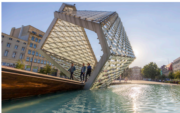
1 Fontanna na placu Wolności

Na zachód od Starego Miasta znajduje się współczesne śródmieście Poznania, którego umowne centrum stanowi plac Wolności . Wokół niego wznosi się wiele ważnych gmachów, m.in. Biblioteka