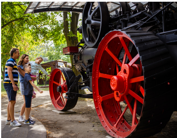
1 Wystawa w Muzeum Narodowym Rolnictwa i Przemysłu Rolno-Spożywczego w Szreniawie

Czy wiecie, jak działa lokomobila albo czym jest podkarmiaczka ramowa boczna? Odpowiedzi na te i podobne pytania można znaleźć w Muzeum Narodowym Rolnictwa i Przemysłu Rolno-Spożywczego w Szreniawie, które zgromadziło ponad 20 tysięcy eksponatów związanych z rolnictwem i przetwórstwem żywności. W jego zbiorach znajdują się zarówno proste narzędzia sprzed wielu wieków, jak i rolnicze samoloty, parowe lokomobile czy cukrownicza linia produkcyjna.