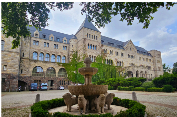
1 Zamek Cesarski

Raczyńskich, Muzeum Narodowe z Galerią Malarstwa i Rzeźby (z jedynym w Polsce obrazem Claude'a Moneta) oraz Hotel Bazar – miejsce, w którym narodziła się idea pracy organicznej. Nowoczesnego sznytu dodaje wykonana ze szkła fontanna oraz pobliski Okrąglak – perła polskiego modernizmu. Plac Wolności to również miejsce organizacji licznych wydarzeń, w tym Poznańskiego Betlejem, festynów i koncertów.