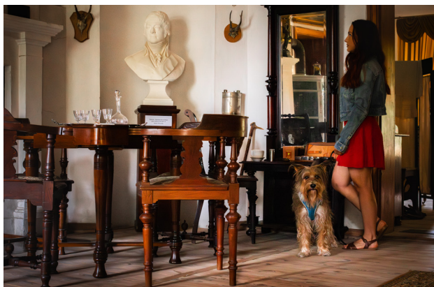
1 Muzeum Ziemi Średzkiej – Dwór w Koszutach

Parter zajmuje wystawa prezentująca, jak żyła typowa rodzina ziemiańska na przelocie XIX i XX w. Całość zaaranżowano tak, jakby mieszkańcy wyszli tylko na chwilę. Na stole rozłożona jest zastawa, zabawki leżą w pokoju dziecięcym, a w gabinecie pana domu na otwartej gazecie spoczywają okulary. Na piętrze budynku można oglądać wystawy czasowe oraz związane z historią Ziemi Średzkiej.