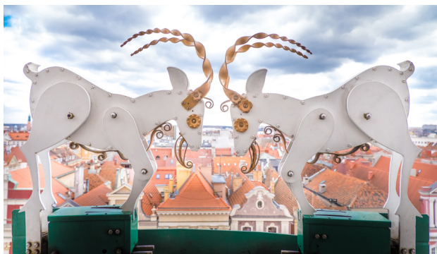
1 Poznańskie koziołki

Na lewo od ratusza znajdują się domki budnicze , urocze, małe kamienice, w których podcieniach niegdyś handlowano śledziami czy świecami. Dzisiaj to jedno z najczęściej fotografowanych zabytków. Tuż obok stoi poznański pręgierz , czyli dawne