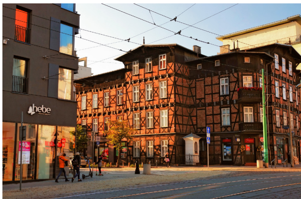
1 Wilda

Jeżyce wydają się z tej trójki najbardziej kameralne, tu i ówdzie zachowały się pozostałości dawnych zabudowań gospodarskich. Zdecydowanie więcej jest jednak kamienic, na parterach których swoje miejsce znalazło wiele najciekawszych knajpek w mieście. Jeżyce to również Stare Zoo , które działa od 1871 r. Zwiedzanie Łazarza najlepiej zacząć od parku Wilsona oraz największej w Polsce Palmiarni , która posiada unikalną kolekcję roślin z całego świata. Stąd tylko kilka kroków do najokazalszych poznańskich kamienic, jak również do genialnie zrewitalizowanych dawnych koszar pełniących funkcję loftów, z licznymi restauracjami i hotelem. Z kolei Wilda to najbardziej robotnicza z trzech wymienionych tu dzielnic, położona tuż obok historycznych zakładów Hipolita Cegielskiego. Wśród wildeckich osobliwości są zarówno kapliczki wkomponowane w ściany kamienic, jak i największe w Europie podwórko w dawnej kolonii robotniczej.