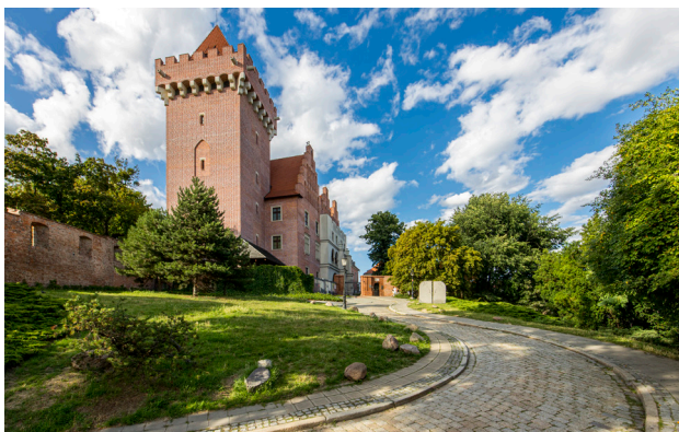
1 Muzeum Sztuk Użytkowych w Zamku Królewskim

miejsce wykonywania różnych nieprzyjemnych kar na przestępcach. Co ciekawe, obecnie jest to ulubiony punkt orientacyjny i miejsce spotkań. Nieco schowana, pomiędzy ratuszem a Wagą Miejską, jest zaś fontanna z figurą Bamberki . Upamiętnia ona osadników z niemieckiego Bambergu, którzy przybyli do Poznania w XVIII w., szybko integrując się w nowym domu i wnosząc ogromny wkład do kultury i tradycji miasta.