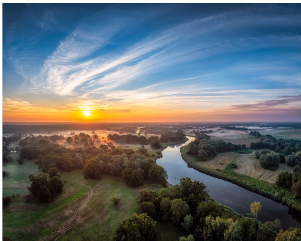
1 Warta w okolicy Rogalina

Poznając region, korzystaj z Kolei Wielkopolskich – aktualny rozkład na: koleje-wielkopolskie.com.pl