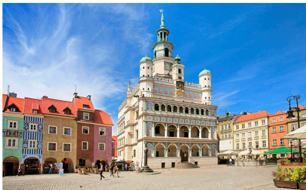
1 Stary Rynek z ratuszem