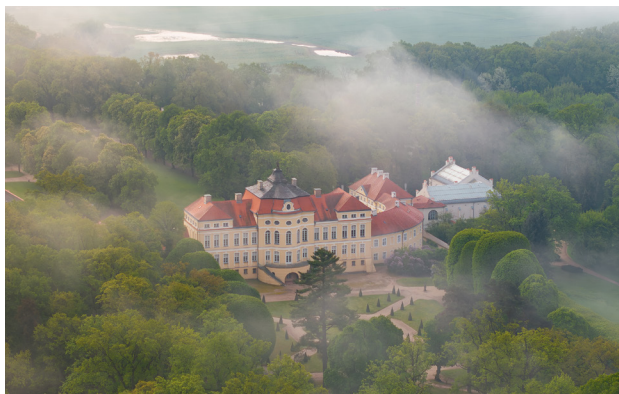
1 Pałac w Rogalinie

Czechem i Rušem oraz dębem Edwardem, a także kościół św. Marcelina, będący kopią rzymskiej świątyni w Nîmes. W kryptach kościelnych znajduje się mauzoleum Raczyńskich.