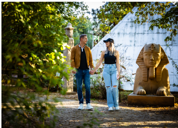
1 Puszczykowo

To eleganckie miasto stanowi swego rodzaju bramę do Wielkopolskiego Parku Narodowego. Zanim obszar ten objęto ochroną, przez wiele lat Puszczykowo było popularnym letniskiem, do którego w ciepłe weekendy poznaniacy tłumnie zjeżdżali pociągami lub przyjeżdżali stateczkiem po Warcie. Dzisiaj Puszczykowo to modelowe miasto ogród , wypetnione eleganckimi willami, często z początku XX w.