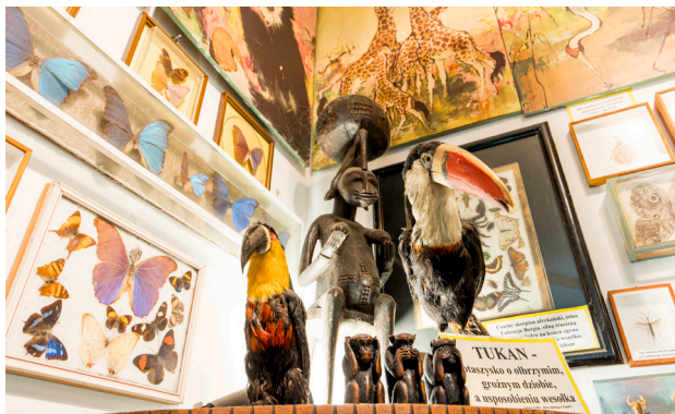
1 Muzeum Arkadego Fiedlera.

Arcyciekawą atrakcją jest Muzeum Pracownia Literacka Arkadego Fiedlera . Legendarny już dzisiaj pisarz podróżnik mieszkał w Puszczykowie, a jego rodzinny dom (zamieszkały nadal przez kolejne pokolenia Fiedlerów) stał się muzeum, pełnym zbiorów z wypraw. Otacza go Ogród Kultur i Tolerancji, z kopiami posągów z Wyspy Wielkanocnej czy rzeźb azteckich. Wśród eksponatów jest wykonana w skali 1:1 replika okrętu Krzysztofa Kolumba oraz myśliwca Hawker Hurricane, którym walczyli polscy lotnicy opisani przez Arkadego Fiedlera w Dywizjonie 303 .