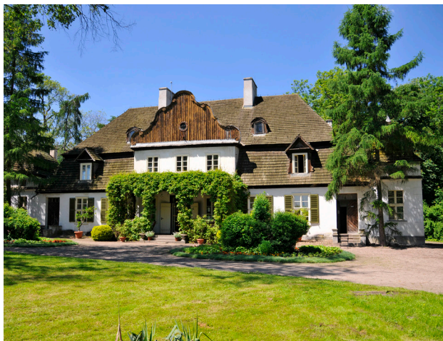
1 Dwór w Koszutach