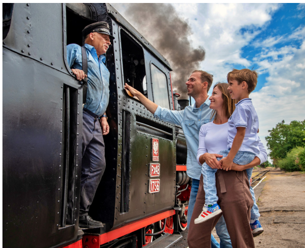
1 Średzka kolejka

Co powiecie na podróż w stylu retro zabytkowymi wagonami ciągniętymi przez lokomotywę parową? Zachowane do dzisiaj 14 km wąskotorowej linii kolejowej to pozostałość po niegdyś znacznie rozleglejszej sieci. Po latach Średzka Kolej Powiatowa została przywrócona do życia przez grono pasjonatów, dzięki którym małe ciuchcie jeżdżą przez całe lato. Kursy odbywają się ze stacji Środa Wielkopolska Miasto do Zaniemyśla . Podróż trwa około godziny, a nieco leniwe tempo jest idealne, aby w pełni docenić okoliczny krajobraz.