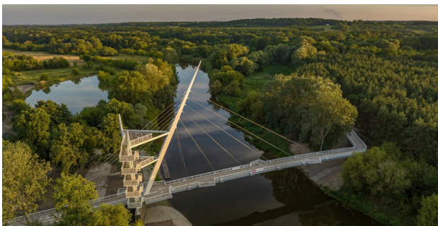
1 Kładka pieszo-rowerowa w Owińskach

Obecnie zabudowania klasztorne mieszczą Specjalny Ośrodek Szkolno-Wychowawczy dla Dzieci Niewidomych, przy którym działa unikatowe Muzeum Tyflogiczne , gromadzące przedmioty związane z kulturą i edukacją niewidomych, a także Aromatorium – Biblioteka Zapachów. Dawne ogrody klasztorne przekształcono w Park Orientacji Przestrzennej , gdzie dzieci niewidzące i słabowidzące mogą uczyć się bezpiecznego poruszania się w terenie.