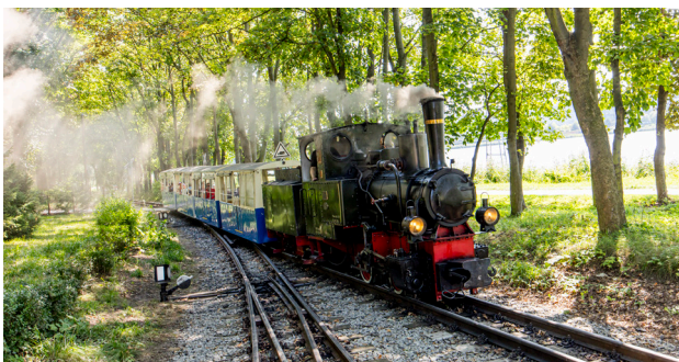
1 Kolejka Maltanka

Połączenie zwiedzania miasta ze zorganizowaniem atrakcji dla dzieci może czasami być wyzwaniem, ale nie w Poznaniu i okolicach! Przyjemność całej rodzinie sprawią z pewnością przejażdżka Kolejką Parkową Maltanka do Nowego Zoo , wspólne lepienie rogali w Rogalowym Muzeum Poznania , warsztaty w Muzeum Czekolady czy wizyta w Muzeum Pyry , barwnie opowiadającym historię tej arcypoznańskiej bulwy.