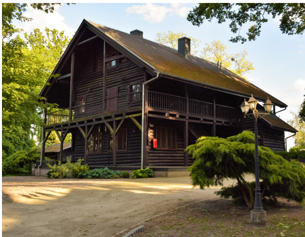
1 Wyspa Edwarda, fot. J. Cieślęwicz

Położony na samym końcu długiej rynny jeziornej Zaniemyśl to bardzo popularna miejscowość na weekendowy wypoczynek. Oczywiście głównym magnesem są tutaj jeziora , z szerokimi piaszczystymi plażami i kąpieliskami. Na brzegu czekają restauracje, wypożyczalnie sprzętu wodnego, a nawet amfiteatr. W pobliżu znajduje się końcowa stacja Średzkiej Kolei Powiatowej.