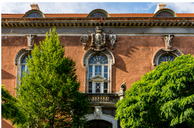
1 Zabytkowa kamienica na Jeżycach

Mając nieco więcej czasu, koniecznie trzeba wyruszyć na odkrywanie trzech historycznych dzielnic miasta: Jeżyc, Łazarza i Wildy, które zostały włączone w jego granice w roku 1900. Każda z nich ma nieco inny charakter, we wszystkich jednak zachowało się wiele zabytkowych kamienic . Zobaczycie tu zarówno najstarsze domy o konstrukcji szachulcowej lub wykonane z muru pruskiego, jak i wyjątkowo zdobne secesyjne kamienice z rzeźbionymi elewacjami i kolorowymi witrażami. Pozostałościami po wiejskich czasach są trzy rynki, które do dzisiaj pełnią swoje funkcje handlowe.