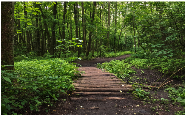
1 Wielkopolski Park Narodowy, fot. A. Jasiński

Wyjątkowym przywilejem mieszkańców Poznania jest to, że do najbliższego parku narodowego mają zaledwie pół godziny jazdy samochodem lub pociągiem. Wielkopolski Park Narodowy to typowy dla regionu krajobraz w miniaturze: łagodnie zielone wzgórza, liczne jeziora, bory sosnowe, grądy i dębiny oraz wijąca się dolina rzeki Warty. Do tego typowa dla Wielkopolski fauna, obejmująca jelenie, sarny, dziki, lisy i borsuki. Z pewnością uda się też dostrzec ślady działalności bobrów. Od czasu do czasu w lasach pojawiają się wilki, te jednak raczej stronią od ludzi. Łatwo natomiast wypatrzyć tutejsze ptaki m.in.: perkoza, czapłę, gęgawę czy żurawia. Sprawne oko dostrzeże również bielika, a ucho wychwyci odgłosy dzięciołów. Symbolem parku jest puszczyk, którego pohukiwania rozlegają się w nocy.