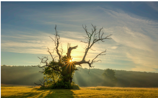
1 Rogaliński Park Krajobrazowy

W dolinie Warty Wielkopolski Park Narodowy płynnie przechodzi w Rogaliński Park Krajobrazowy. Tutaj krajobraz wyraźnie się zmienia, tworząc mozaikę malowniczych zakoli Warty, licznych starorzeczy oraz łąk i pól uprawnych. Prawdziwym symbolem parku są jednak prastare dęby , których naliczono tutaj około 1500 (860 to pomniki przyrody).