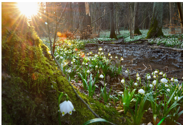
1 Śnieżycowy Jar

Rezerwat Śnieżycowy Jar jest dla mieszkańców Poznania i okolic swoistym barometrem wskazującym nadejście wiosny. Tutaj rośnie śnieżyca wiosenna – drobny biały kwiat, który masowo zakwita na początku wiosny tworząc w lesie prawdziwe kwietne dywany. W naturze śnieżycy występuje na górskich łąkach, m.in. w Sudetach i Karpatach. Stąd przypuszczenie, że została posadzona w tym miejscu ręką człowieka pod koniec XIX w.