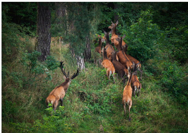
1 Stado jeleni w Puszczy Noteckiej, fot. P. Nowak

Puszcza Notecka, położona między Wartą a Notecią, na obszarze województwa wielkopolskiego i częściowo lubuskiego, jest jednym z największych kompleksów leśnych w Polsce. To prawdziwy raj dla miłośników przyrody, ciszy i aktywnej turystyki. Kompleks lasów porasta głównie piaszczyste tereny wydumowe, tworzące krajobraz pofalowany, miejscami pagórkowaty, świetnie nadający się na piesze i rowerowe wycieczki. Znajduje się tu kilkanaście rezerwatów przyrody. Puszcza przyciąga swoimi walorami o każdej porze roku, a szczególnie popularna staje się jesienią ze względu na obfitość grzybów.