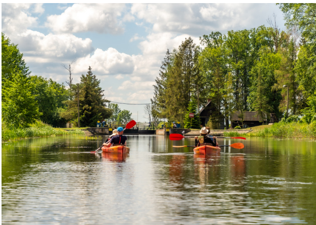
1 Spływy kajakowy Notecią, fot. Szalone Walizki – J. Kowalski

Rzeka jest spokojna, choć w Ujściu i Krzyżu jej nurt przyspiesza. Szczególnie urokliwy jest odcinek w okolicach Czarnkowa, gdzie płynięcie wśród wzgórz. Warto zatrzymać się, by zwiedzić Muzeum Kultury Ludowej w Osieku, zabytki Czarnkowa czy pałac Sapiehów w Wieleniu. Dolina Noteci to ostoja ptactwa wodnego i brodzącego, bogata w roślinność bagienną i torfowiskową.