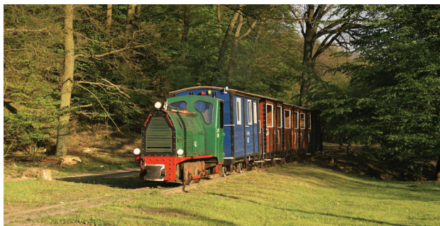
1 Wyrzyńska Kolej Powiatowa, fot. J. Gotębecki

Z Białosiłwia w sezonie letnim można wyruszyć w niesamowitą podróż w stylu retro kolejką wąskotorową. Trasa jest krótka, ale prowadzi przez las i skrajem leśnego strumienia. Do tego można niespiesznie zwiedzić dawną lokomotywnię. Wyrzyńska Kolej Powiatowa jest także wyjątkowa pod względem rozstawu szyn – wynosi on zaledwie 600 mm. Kolejka dysponuje sprawnym parowozem oraz lokomotywą spalinową, które nadają przejazdowi niepowtarzalny klimat.