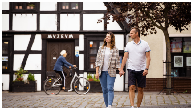
1 Złotów – Muzeum Ziemi Złotowskiej

Złotów , będący sercem Krajny, leży nad rzeką Głomią i kilkoma jeziorami. To nad wodą toczy się życie tego urokliwego miasta. Tam biegnie malownicza promenada, działają restauracje, organizowane są koncerty w miejskim amfiteatrze. Niedaleko znajduje się Zagroda Krajeńska (filia Muzeum Ziemi Złotowskiej), w której dawne dzieje i tradycje ożywają na oczach zwiedzających. W skansenie można zobaczyć dom z XVIII w. i budynki gospodarcze. Charakterystyczna dla regionu jest szachulcowa zabudowa w biało-czarną kratę. W tym stylu zbudowany jest też gmach głównej siedziby muzeum, stojący przy jednej z ulic łączących dwa złotowskie rynki. W obu filiach można nie tylko odkrywać tradycje Krajniaków, w tym w szczególności błękitny haft krajeński, ale także wziąć udział w warsztatach i lekcjach muzealnych. Dzięki nim każdy będzie mieć szansę własnoręcznie stworzyć unikatowe przedmioty, w twórczy sposób adaptujące charakterystyczny wzór lokalnego haftu.