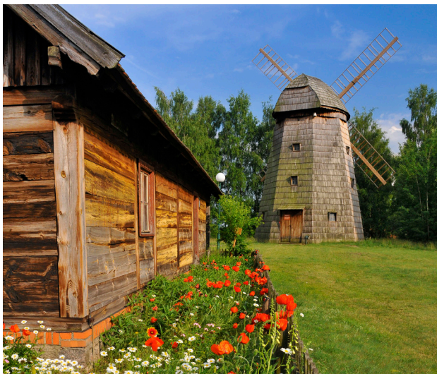
1 Osiek nad Notecią – skansen

Wizyta w Muzeum Kultury Ludowej w Osieku nad Notecią jest niemal jak podróż w czasie, przenosząca prawie dwa wieki w przeszłość. Można tutaj zobaczyć, jak dawniej żyli ludzie na północy Wielkopolski, gdzie mieszały się różne wpływy, tradycje i kultury. W skansenie zgromadzono wiele budynków, zabudowań gospodarczych i mniejszych budowli charakterystycznych dla wiejskiego krajobrazu regionu, począwszy od XVIII do XX w. Są wśród nich chaty, budynki gospodarskie, stodoły, tartak, wiatraki, a nawet cała kuźnia. Można tu zauważyć różnicę w budowie i konstrukcji wiatraków: koźlaków, paltraków i holendrów. Wnętrza budynków nie są puste, zostały wyposażone w sprzęty używane przez mieszkańców na co dzień. W remizie można oglądać bogatą kolekcję dawnego sprzętu pożarniczego. Dużą atrakcją są też imprezy folklorystyczne prezentujące odchodzące w zapomnienie rzemiosła i umiejętności.