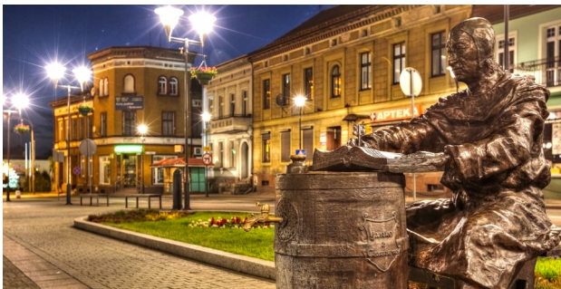
1 Czarnków – pomnik Janka z Czarnkowa

Podróżując dalej szlakiem Wielkiej Pętli Wielkopolski, można zatrzymać się również w dobrze wyposażonej marinie Yndzel w Drawsku, skąd blisko już do zwiedzania wspomnianego wcześniej Parku Grzybowego w Pitce.