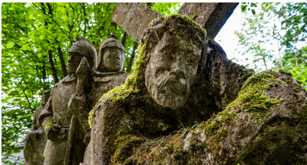
1 Ujście – kalwaria

Jak sugeruje nazwa, Ujście leży w ujściu Gwdy do Noteci. To tutaj podczas potopu szwedzkiego polskie wojska skapitulowały przed królem Szwecji, co opisał w Trylogii Henryk Sienkiewicz. Dzisiaj Ujście znane jest przede wszystkim z produkcji szkła, o czym przypomina nie tylko ogromny komin huty, ale również ciekawy pomnik dmuchacza szkła.