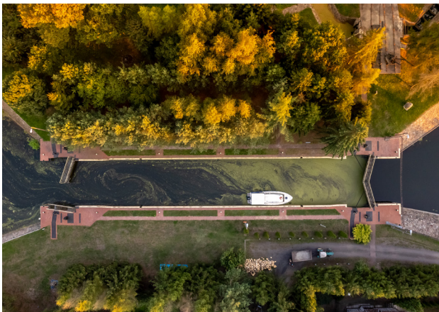
1 Notec – śluza w Wieleniu

Noteć to największa rzeka północnej Wielkopolski, popularna wśród kajakarzy i właścicieli jachtów motorowych. Szlak jest łatwy, malowniczy i pełen atrakcji, takich jak śluzy. Nadaje się na spływy indywidualne i rodzinne, a cały odcinek kajakiem można pokonać w 10 dni. Wodowanie jest możliwe w prawie każdym miasteczku nad Notecią, warto korzystać z przystani w Drawsku, Wieleniu, Czarnkowie i Nakle .