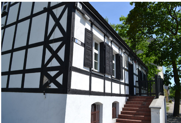
1 Piła – Muzeum S. Staszica

Miasto jest położone wśród gęstych lasów nad wijącą się setkami zakoli Gwdą, prawym dopływem Noteci. To rzeca tutejsza średnio-wieczna rybacka osada zawdzięczała swój początkowy rozkwit. Mieszkańcy trudnili się także obróbką drewna z okolicznych lasów, stąd najprawdopodobniej wzięta się nazwa Piła. Choć miasto ma długą historię, zniszczenia wojenne spowodowały, że nie może pochwalić się wieloma obiektami historycznymi. Turyści mogą tu odwiedzić kilka miejsc, przede wszystkim zabytkowy dom Stanisława Staszica , w którym obecnie znajduje się muzeum poświęcone temu wybitnemu działaczowi okresu Oświecenia. W Muzeum Okręgowym natomiast można zapoznać się z historią Piły i regionu. W kościele św. Antoniego najciekawszym elementem wyposażenia jest wiszący nad ołtarzem głównym 7,5-metrowy drewniany krucyfik, jeden z największych w Europie. Miłośnicy militariów zdecydowanie powinni odwiedzić Piłskie Muzeum Wojskowe , które prezentuje eksponaty związane z historią miasta i wojsk w nim stacjonujących. Zgromadzono tu m.in. systemy łączności, samoloty, czołgi, które można obejrzeć zarówno z zewnątrz, jak i w środku.