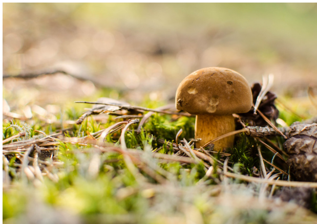
1 Puszcza Notecka

Puszcza Notecka, położona między Wartą a Notecią, na obszarze województwa wielkopolskiego i częściowo lubuskiego, jest jednym z największych kompleksów leśnych w Polsce. To prawdziwy raj dla miłośników przyrody, ciszy i aktywnej turystyki. Kompleks lasów porasta głównie piaszczyste tereny wydumowe, tworzące krajobraz pofalowany, miejscami pagórkowaty, świetnie nadający się na piesze i rowerowe wycieczki. Znajduje się tu kilkanaście rezerwatów przyrody. Puszcza przyciąga swoimi walorami o każdej porze roku, a szczególnie popularna staje się jesienią ze względu na obfitość grzybów.