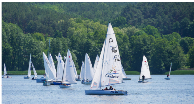
† Chodzież - Jezioro Chodzieskie, fot. N. Pawłowska

sukiennicy. Pozostałością po zwartej zabudowie rzemieślniczej, jaką tu stworzyli, są tzw. domy tkaczy przy ulicach Kościuszki i Wojska Polskiego. Architektoniczną lokalną ciekawostką jest zrewitalizowany lamus tkacki z XVIII w., który po odrestaurowaniu postawiono na terenie parku przy Miejskiej Bibliotece Publicznej. Dawniej lamusy służyły jako magazyny, budynki gospodarcze lub miejsca służące do przechowywania różnych rzeczy. Te chodzieskie były wykorzystywane przez sukienników i składowano w nich włókna. W XIX w. Chodzież słynęła już nie tylko z sukiennictwa, ale również z wyrobu porcelany, która stała się wyróżnikiem tego regionu i symbolem miasta. Jeszcze dziś w wielu polskich domach w podstawowym wyposażeniu kuchni znajdziemy charakterystyczne chodzieskie peretki, czyli bogato zdobione porcelanowe zestawy oraz naczynia. Wspomnienia ceramicznej historii można podziwiać w budynku Miejskiej Biblioteki Publicznej, gdzie zgromadzono ponad 200 eksponatów związanych z historią fajansu, porcelitu i porcelany.