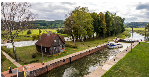
1 Wielka Pętla Wielkopolski – Śluza na Noteci w Pianówce

To najdłuższy znakowany szlak turystyki wodnej w Polsce, prowadzący przez trzy województwa: wielkopolskie, kujawsko-pomorskie i lubuskie. Łączy drogi wodne Polski z siecią dróg wodnych Europy Zachodniej poprzez Odrę i Sprewę oraz z Europą Wschodnią przez Wisłę, Narew i Niemen. Północna część Pętli należy do Międzynarodowej Drogi Wodnej E70 prowadzącej z Antwerpii do Kłajpedy. Wielka Pętla Wielkopolski liczy 688 km i obejmuje rzeki Wartę i Noteć, ciąg malowniczych jezior od Gopta aż po Jezioro Ślesińskie i Jezioro Mikołczyńskie oraz żeglowne kanały: Ślesiński i Górnonotecki. Wszystkie połączone w jeden szlak, tworzący pętlę. Krótko mówiąc, można płynąć bez końca. To niezwykle atrakcyjny szlak o zróżnicowanym środowisku przyrodniczym i kulturowym. Na znacznej jego części znajdują się parki krajobrazowe i obszary Natura 2000, gdzie przyroda objęta jest ochroną. Historyczne krainy: Wielkopolska, Kujawy i ziemia lubuska pozwolą turystom poznać miasta z interesującymi zabytkami. Dużą atrakcją są budowle hydrotechniczne. Na szlaku znajduje się 28 śluz umożliwiających pokonywanie różnic poziomu wody. Na wodniaków czeka tu kilkadziesiąt przystani i marin, zapewniających nie tylko miejsce do odpoczynku (z prysznicami i podłączeniem do sieci elektrycznej), ale też możliwość tankowania, zrobienia zakupów czy bezpiecznego pozostawienia łodzi i zwiedzenia okolicy.