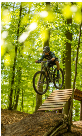
1 Chodzież – Gontyniec Bike Park

Historia Chodzieży łączy się z dwoma rzemiosłami: włókienniczym i produkcji porcelany. W XVIII w. sprowadzili się do miasta