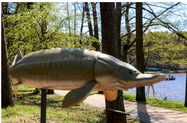
1 Trzcianka – Park Ryb Śłodkowodnych w Trzciance, fot. arch. UM w Trzciance

Małowniczo położona wśród lasów i okolicznych jezior Trzcianka jest atrakcyjnym miejscem wypoczynku. Słynie z uwielbianego przez wędkarzy jeziora Sarcz . Ci, którzy nie znają się na rybach, mogą uzupełnić wiedzę w pierwszym w Polsce Parku Ryb Śłodkowodnych . Wzdłuż malowniczych ścieżek pieszo-rowerowych przy jeziorze stoją ogromne, kolorowe modele ryb, a także tablice z informacjami na ich temat i rybackimi ciekawostkami. Nad jeziorem znajduje się piękna plaża z pomostem, przystanią żeglarską, wypożyczalnią sprzętu wodnego i kortem tenisowym. Na jeziorze odbywają się zawody motorowodne. Natomiast z lokalną historią można zapoznać się w Muzeum Ziemi Nadnoteckiej .