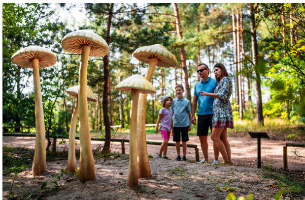
1 Piłka – Park Grzybowy

To niewielka miejscowość położona w gminie Drawsko, której dużą część zajmuje Puszcza Notecka, słynąca z lasów pełnych owoców runa leśnego, w tym jadalnych grzybów. Nic zatem dziwnego, że właśnie tutaj na obszarze 1 ha utworzono ciekawą ścieżkę edukacyjno-przyrodniczą – Park Grzybowy . Wyjątkowe w nim jest to, że grzyby są gigantyczne, często przekraczają wzrost przeciętnego człowieka. Oprócz grzybowych modeli w parku ustawiono tablice informacyjne, z których można dowiedzieć się wielu ciekawostek. Najmłodszy turyści z pewnością docenią plac zabaw w kształcie grzybowych domków, a także chętnie poszukają naturalnych rozmiarów modeli leśnych zwierząt – sarny, jelenia i dzika.