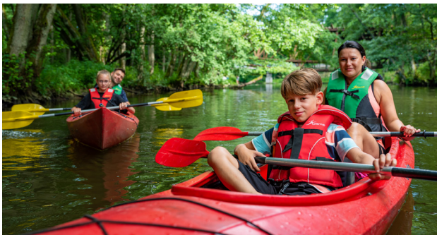
1 Gwda, fot. M. Jankowski

Północne krańce Wielkopolski są gęsto poprzecinane rzekami i licznymi jeziorami, często wciśniętymi pomiędzy strome pagórki. Poza wspaniałym krajobrazem tworzy to świetne warunki do kajakarstwa. Można wybrać płynącą przez Złotów Głomię , której bieg, oddalony od większych miast, pozwala rozkoszować się przyrodą. Nie jest to jednak szlak łatwy i polecany jest raczej doświadczonym kajakarzom.