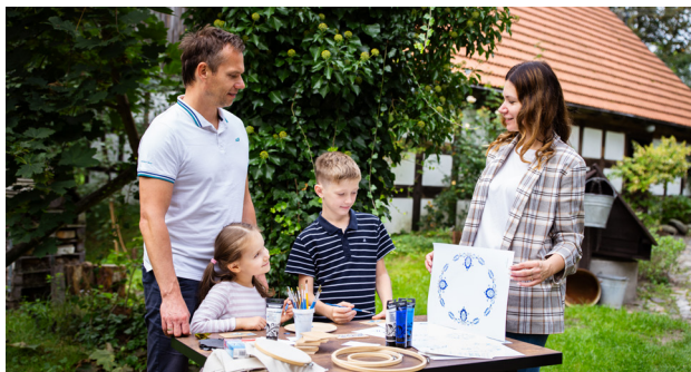
1 Złotów – Warsztaty w Zagrodzie Krajeńskiej

Krajna to kraina historyczna leżąca na skraju (czyli na granicy) Wielkopolski, Pomorza i Kaszub. W tym miejscu przez wieki kształtowała się unikalna tożsamość i kultura Krajniaków. Jednak Krajna przyciąga nie tylko miłośników etnografii – rowery, kajaki, leśne wędrówki czy kąpiele w jednym z kilkudziesięciu jezior to zaledwie kilka propozycji spędzania czasu.