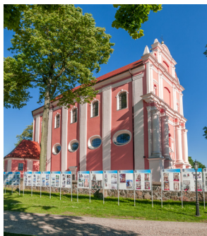
1 Skrzatusz, fot. D. Bednarek