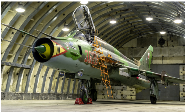
1 Piła – Samolot Su-22M4 w Piłskim Muzeum Wojskowym

Miasto jest położone wśród gęstych lasów nad wijącą się setkami zakoli Gwdą, prawym dopływem Noteci. To rzeca tutejsza średnio-wieczna rybacka osada zawdzięczała swój początkowy rozkwit. Mieszkańcy trudnili się także obróbką drewna z okolicznych lasów, stąd najprawdopodobniej wzięta się nazwa Piła. Choć miasto ma długą historię, zniszczenia wojenne spowodowały, że nie może pochwalić się wieloma obiektami historycznymi. Turyści mogą tu odwiedzić kilka miejsc, przede wszystkim zabytkowy dom Stanisława Staszica , w którym obecnie znajduje się muzeum poświęcone temu wybitnemu działaczowi okresu Oświecenia. W Muzeum Okręgowym natomiast można zapoznać się z historią Piły i regionu. W kościele św. Antoniego najciekawszym elementem wyposażenia jest wiszący nad ołtarzem głównym 7,5-metrowy drewniany krucyfik, jeden z największych w Europie. Miłośnicy militariów zdecydowanie powinni odwiedzić Piłskie Muzeum Wojskowe , które prezentuje eksponaty związane z historią miasta i wojsk w nim stacjonujących. Zgromadzono tu m.in. systemy łączności, samoloty, czołgi, które można obejrzeć zarówno z zewnątrz, jak i w środku.