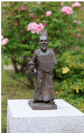
Chodzież – karzettek dziedzic †

W zwiedzaniu Chodzieży pomagają karzетки płomieniste, wywodzące się z książki pt. Opowieści i legendy chodzieskie . Każdy z karzettek jest niepowtarzalny i ma przypisany jakiś atrybut. Aż 11 z nich tworzy nowy chodzieski szlak, który prezentuje świeże spojrzenie na lokalne atrakcje. Figurki wykonane z brązu występują w różnych częściach miasta, a do tych najbardziej charakternych zalicza się np. karzettek strażak, żeglarz czy narciarz.