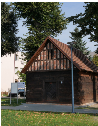
1 Chodzież - lamus tkacki w parku „Odpooczywaj z kulturą”