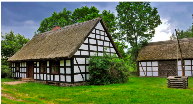
1 Osiek nad Notecią – skansen

Wizyta w Muzeum Kultury Ludowej w Osieku nad Notecią jest niemal jak podróż w czasie, przenosząca prawie dwa wieki w przeszłość. Można tutaj zobaczyć, jak dawniej żyli ludzie na północy Wielkopolski, gdzie mieszały się różne wpływy, tradycje i kultury. W skansenie zgromadzono wiele budynków, zabudowań gospodarczych i mniejszych budowli charakterystycznych dla wiejskiego krajobrazu regionu, począwszy od XVIII do XX w. Są wśród nich chaty, budynki gospodarskie, stodoły, tartak, wiatraki, a nawet cała kuźnia. Można tu zauważyć różnicę w budowie i konstrukcji wiatraków: koźlaków, paltraków i holendrów. Wnętrza budynków nie są puste, zostały wyposażone w sprzęty używane przez mieszkańców na co dzień. W remizie można oglądać bogatą kolekcję dawnego sprzętu pożarniczego. Dużą atrakcją są też imprezy folklorystyczne prezentujące odchodzące w zapomnienie rzemiosła i umiejętności.