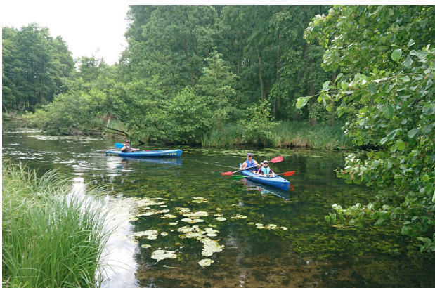
1 Spływ kajakowy Drawą

Rzeka Drawa znana jest z krystalicznie czystej wody i urzekających krajobrazów. To jeden z najpiękniejszych szlaków kajakowych w Polsce, wymagający ze względu na szybki nurt, bystrza i powalające drzewa. Drawa zachwyca swoją różnorodnością – od rozległych jezior i starych lasów, przez bezkresne łąki i trzcinowe brzegi, po malownicze odcinki z liliami wodnymi oraz strome, wysokie zbocza. Ta różnorodność sprawia, że spływ kajakowy jest niezwykle atrakcyjny. Trzeba jednak pamiętać, że fragment rzeki przebiegający przez poligon wojskowy jest zamknięty dla kajakarzy, a na odcinku na terenie Drawieńskiego Parku Narodowego obowiązują sezonowe i liczne ograniczenia.