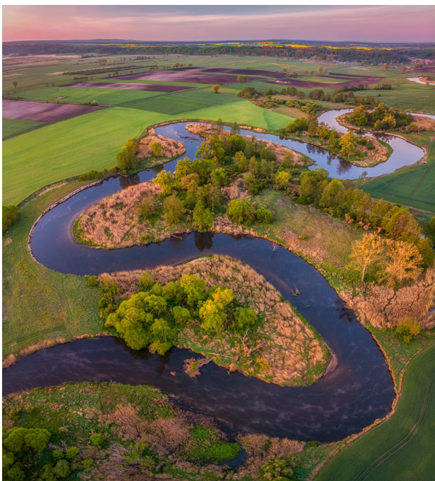
1 Gwda