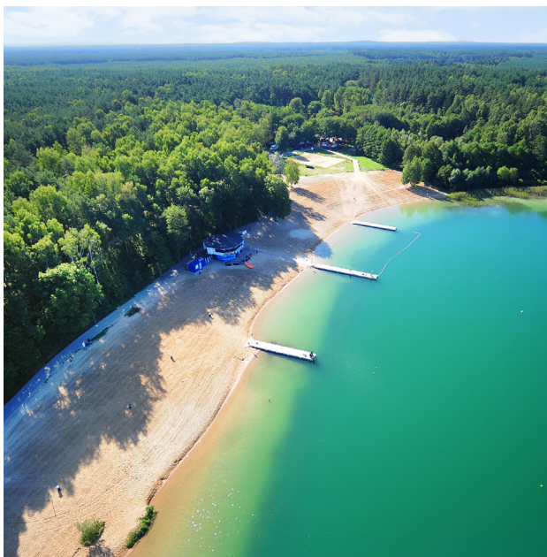
† Plaża nad jeziorem Płotki w okolicach Pity, fot. R. Judycki

Poznając region, korzystaj z Kolei Wielkopolskich – aktualny rozkład na: koleje-wielkopolskie.com.pl