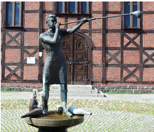
1 Ujście – dmuchacz szkła

Na stoku jednego z otaczających miasteczko wzgórz morenowych na przelocie XIX i XX w. zbudowano kalwarię, czyli drogę krzyżową, z 14 kaplicami. Dziś można oglądać zaledwie kilka zabytkowych kapliczek, jednak krótka wycieczka dostarcza wielu wrażeń. Zwieńczeniem wspinaczki jest wieża widokowa na skraju głębokiej Doliny Noteci. W tym miejscu przebiegała historyczna granica pomiędzy Wielkopolską a Pomorzem.