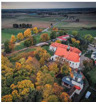
1 Górka Klasztorna

Wśród zielonych wzgórz, w Górcie Klasztornej niedaleko Łobzenicy wznosi się bazylika Najświętszej Maryi Panny Niepokalanie Poczętej. Według podań jest to najstarsze sanktuarium maryjne w Polsce. Jego popularność wśród pątników datuje się już od 1079 r., kiedy Matka Boska objawia się tutaj pasterzowi. Dzisiaj jest to rozbudowany kompleks sakralno-pielgrzymkowy, ale też ciekawe miejsce, gdzie bogata sztuka i architektura baroku miesza się z ludową religijnością.