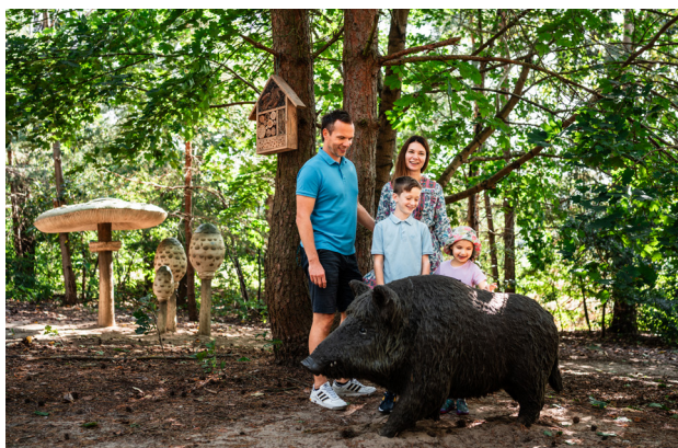
1 Piłka – Park Grzybowy

To niewielka miejscowość położona w gminie Drawsko, której dużą część zajmuje Puszcza Notecka, słynąca z lasów pełnych owoców runa leśnego, w tym jadalnych grzybów. Nic zatem dziwnego, że właśnie tutaj na obszarze 1 ha utworzono ciekawą ścieżkę edukacyjno-przyrodniczą – Park Grzybowy . Wyjątkowe w nim jest to, że grzyby są gigantyczne, często przekraczają wzrost przeciętnego człowieka. Oprócz grzybowych modeli w parku ustawiono tablice informacyjne, z których można dowiedzieć się wielu ciekawostek. Najmłodszy turyści z pewnością docenią plac zabaw w kształcie grzybowych domków, a także chętnie poszukają naturalnych rozmiarów modeli leśnych zwierząt – sarny, jelenia i dzika.