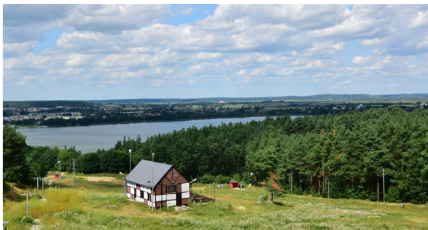
1 Chodzież – widok na Jezioro Chodzieskie, fot. arch. UM w Chodzieży

To jedno z najpiękniej położonych miast w Wielkopolsce – w kotlinie otoczonej wzgórzami nad trzema jeziorami: Chodzieskim (zwanym także Miejskim), Strzeleckim i Karczewnik, dlatego często nazywa się ten rejon Szwajcarią Chodzieską. Zdecydowanie można tu postawić na aktywny wypoczynek. Są bowiem świetne warunki do uprawiania żeglarstwa, kajakarstwa, narciarstwa wodnego i sportów motorowodnych. W sezonie po Jeziorku Chodzieskim pływa stateczek wycieczkowy Chodzieżanka. Do jeziora przylega góra o nazwie Talerz , na której zboczach znajduje się stok narciarski z wyciągiem. Wiosną i latem organizowane są tutaj różne wydarzenia kulturalne. Okoliczne wzgórza można również zwiedzać z perspektywy rowerzysty. Idealnym miejscem do uprawiania turystyki rowerowej jest wzgórze Gontyniec . Z miasta, a konkretniej z parku 3 Maja, na szczyt prowadzi Rodzinna Ścieżka Rowerowa o długości 4,8 km, a na samej górze znajdują się trzy leśne, wymagające trasy zjazdowe typu singletrack.