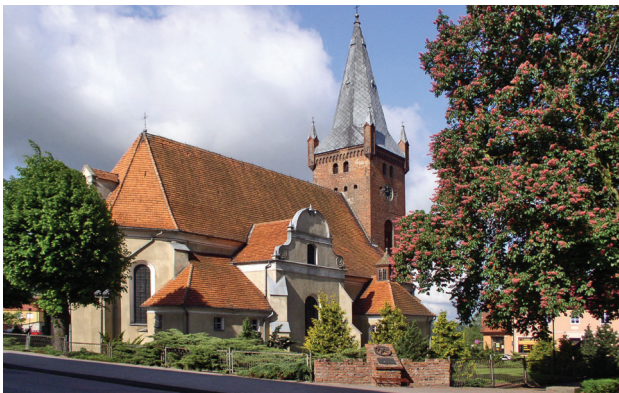
1 Czarnków – kościół św. Marii Magdaleny, fot. arch. UM w Czarnkowie, S. Czarnecki

To miasto położone na skraju Pojezierza Chodzieskiego, Kotliny Gorzowskiej i Doliny Noteci wśród morenowych wzgórz, które wyrzeźbił cofający się lądolód. Z tego powodu rejon ten nazywany bywa Szwajcarią Czarnkowską. Sercem miasta jest rynek ozdobiony nowoczesnymi fontannami, podświetlanymi po zmroku różnobarwnymi światłami. Warto odwiedzić późnogotycki kościół św. Marii Magdaleny. Z miastem kojarzy się tradycyjnie warzone piwo oraz średniowieczny kronikarz Janko z Czarnkowa, którego pomnik stoi na rynku. Z lokalną historią można zapoznać się w Muzeum Ziemi Czarnkowskiej , gdzie zgromadzono pamiątki dawnej i obecnej kultury ludowej regionu. Najbardziej charakterystyczne miejsca Czarnkowa, jak kościół farny, browar czy wieża ciśnień, przedstawiono na pięknym muralu namalowanym na ścianie kamienicy przy pl. Jana Karskiego. Położony nad Notecią, na trasie Wielkiej Pętli Wielkopolski, Czarnków stawia na turystykę wodną. Może pochwalić się m.in. nowoczesną mariną, doskonale przystosowaną do zaspokojenia potrzeb turysty wodniaka.