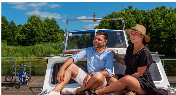
1 Wielka Pętla Wielkopolski – przystań w Drawsku

To najdłuższy znakowany szlak turystyki wodnej w Polsce, prowadzący przez trzy województwa: wielkopolskie, kujawsko-pomorskie i lubuskie. Łączy drogi wodne Polski z siecią dróg wodnych Europy Zachodniej poprzez Odrę i Sprewę oraz z Europą Wschodnią przez Wisłę, Narew i Niemen. Północna część Pętli należy do Międzynarodowej Drogi Wodnej E70 prowadzącej z Antwerpii do Kłajpedy. Wielka Pętla Wielkopolski liczy 688 km i obejmuje rzeki Wartę i Noteć, ciąg malowniczych jezior od Gopta aż po Jezioro Ślesińskie i Jezioro Mikołczyńskie oraz żeglowne kanały: Ślesiński i Górnonotecki. Wszystkie połączone w jeden szlak, tworzący pętlę. Krótko mówiąc, można płynąć bez końca. To niezwykle atrakcyjny szlak o zróżnicowanym środowisku przyrodniczym i kulturowym. Na znacznej jego części znajdują się parki krajobrazowe i obszary Natura 2000, gdzie przyroda objęta jest ochroną. Historyczne krainy: Wielkopolska, Kujawy i ziemia lubuska pozwolą turystom poznać miasta z interesującymi zabytkami. Dużą atrakcją są budowle hydrotechniczne. Na szlaku znajduje się 28 śluz umożliwiających pokonywanie różnic poziomu wody. Na wodniaków czeka tu kilkadziesiąt przystani i marin, zapewniających nie tylko miejsce do odpoczynku (z prysznicami i podłączeniem do sieci elektrycznej), ale też możliwość tankowania, zrobienia zakupów czy bezpiecznego pozostawienia łodzi i zwiedzenia okolicy.